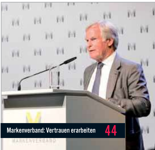
Markenverband: Vertrauen erarbeiten 44