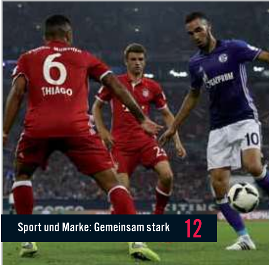
Sport und Marke: Gemeinsam stark 12