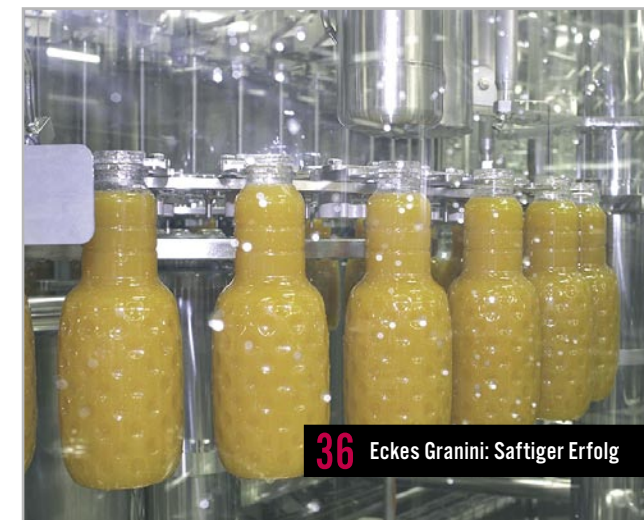
36 Eckes Granini: Saftiger Erfolg

In dieser Ausgabe befindet sich eine Beilage der MENNEKES Elektrotechnik GmbH & Co. KG. Wir bitten um Beachtung.