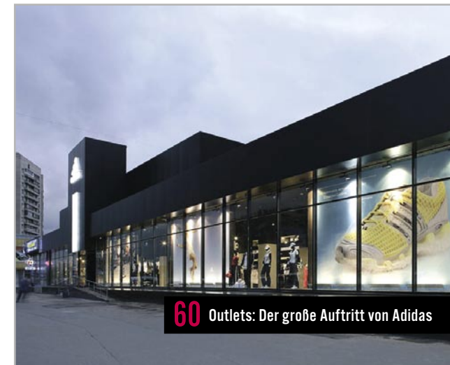
60 Outlets: Der große Auftritt von Adidas