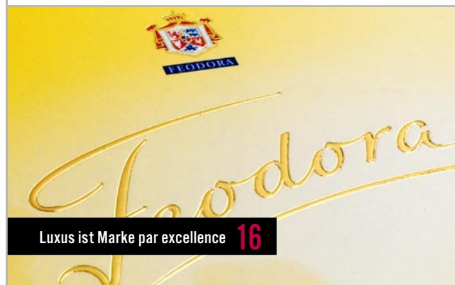
Luxus ist Marke par excellence 16