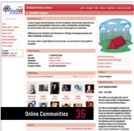
Online Communities 36