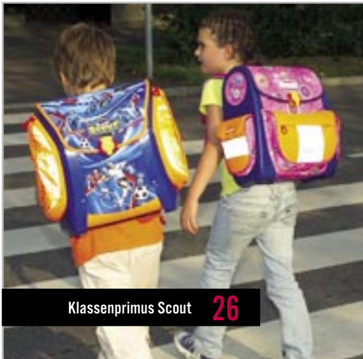
Klassenprimus Scout 26