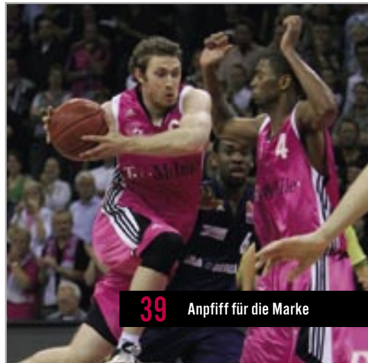
39 Anpiff für die Marke