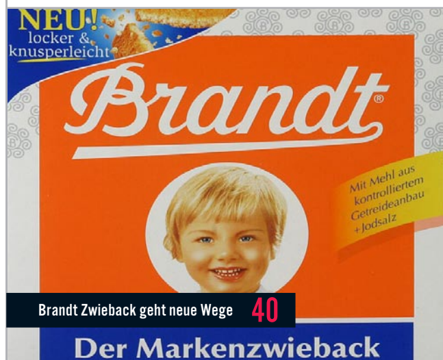
Brandt Zwieback geht neue Wege 40

in befreiendes Votum Aus der Rolle gefallen