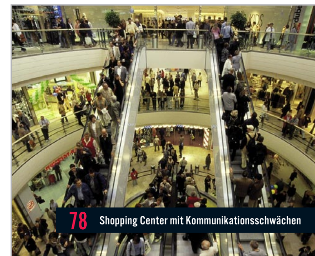
78 Shopping Center mit Kommunikationsschwächen