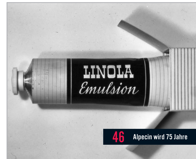
46 Alpecin wird 75 Jahre

Beilagenhinweis: In dieser Ausgabe befindet sich eine Beilage der Management Circle AG, Hauptstraße 129, 65731 Eschborn/Ts., www.managementcircle.de. Wir bitten um Beachtung.