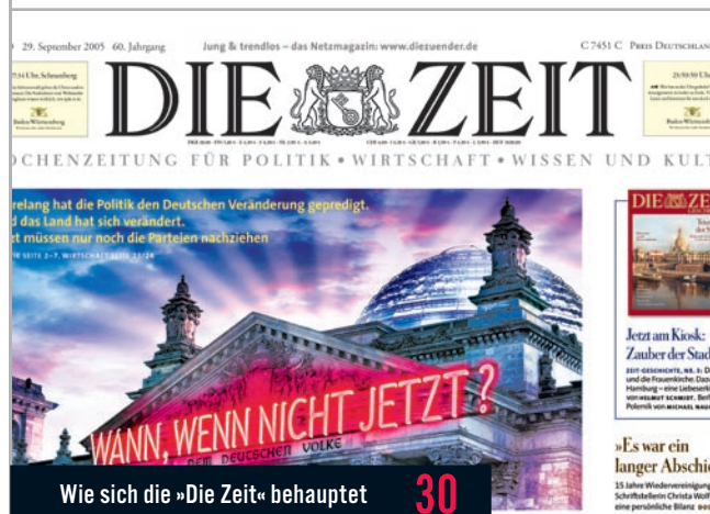
Wie sich die »Die Zeit« behauptet 30

in befreiendes Votum Aus der Rolle gefallen