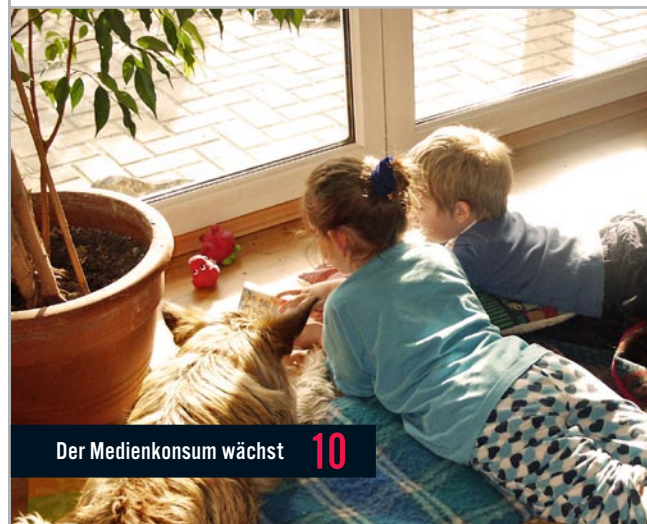
Der Medienkonsum wächst 10