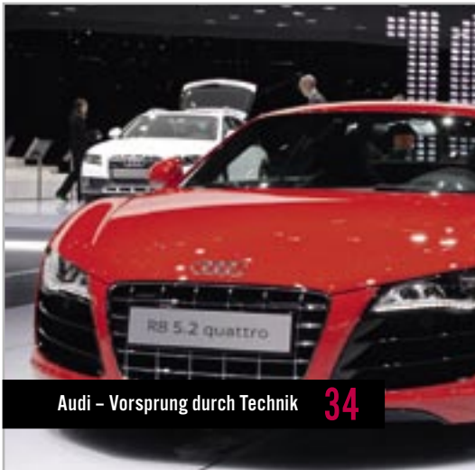
Audi – Vorsprung durch Technik 34