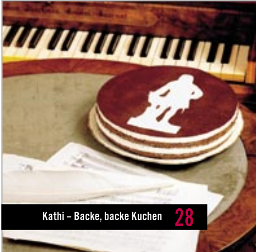
Kathi – Backe, backe Kuchen 28