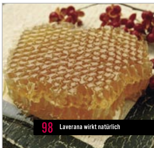
98 Laverana wirkt natürlich