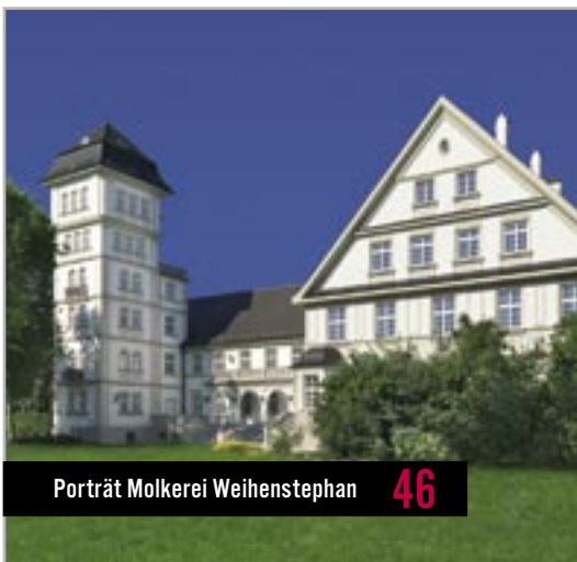
Porträt Molkerei Weihenstephan 46