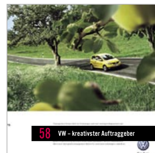
58 VW – kreativster Auftraggeber