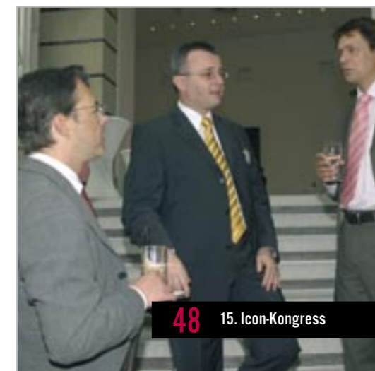
48 15. Icon-Kongress