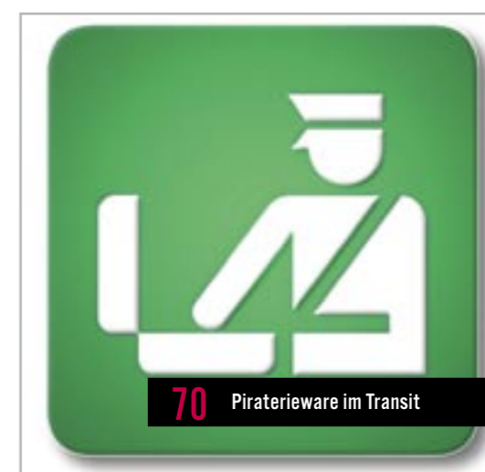
70 Piraterieware im Transit