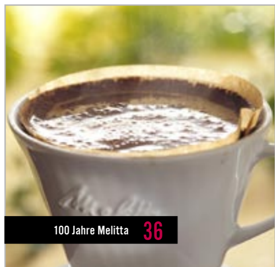
100 Jahre Melitta 36