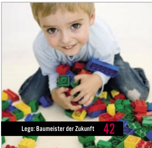
Lego: Baumeister der Zukunft 42