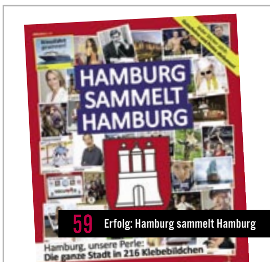
59 Erfolg: Hamburg sammelt Hamburg