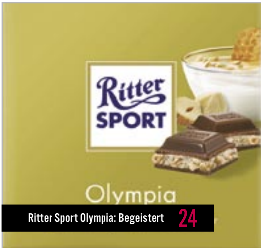
Ritter Sport Olympia: Begeistert 24