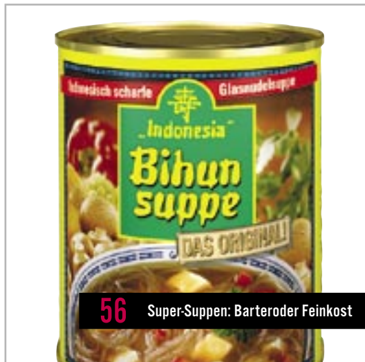
56 Super-Suppen: Barteroder Feinkost