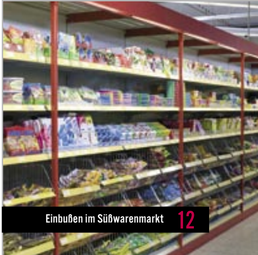
Einbußen im Süßwarenmarkt 12