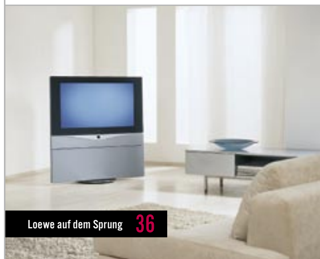
Loewe auf dem Sprung 36