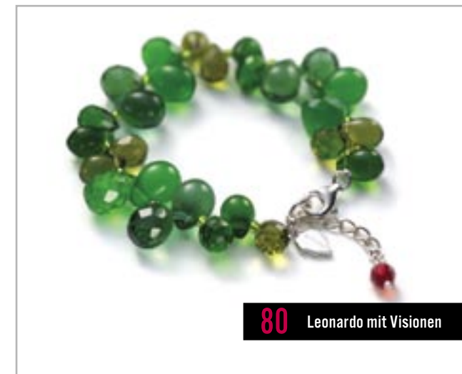
80 Leonardo mit Visionen