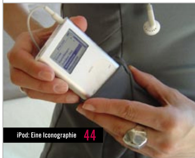
iPod: Eine Iconographie 44