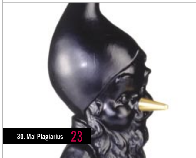
30. Mal Plagiarius 23