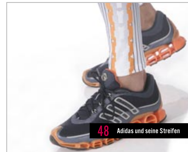
48 Adidas und seine Streifen