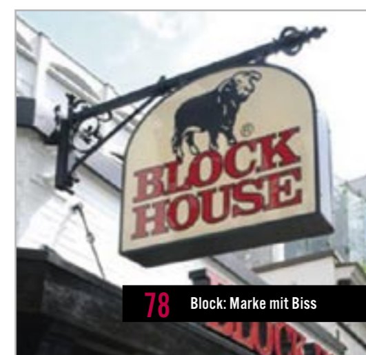
78 Block: Marke mit Biss