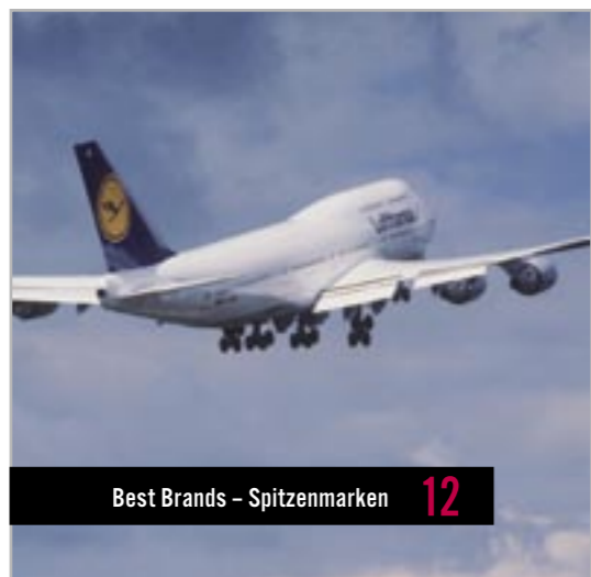
Best Brands – Spitzenmarken 12