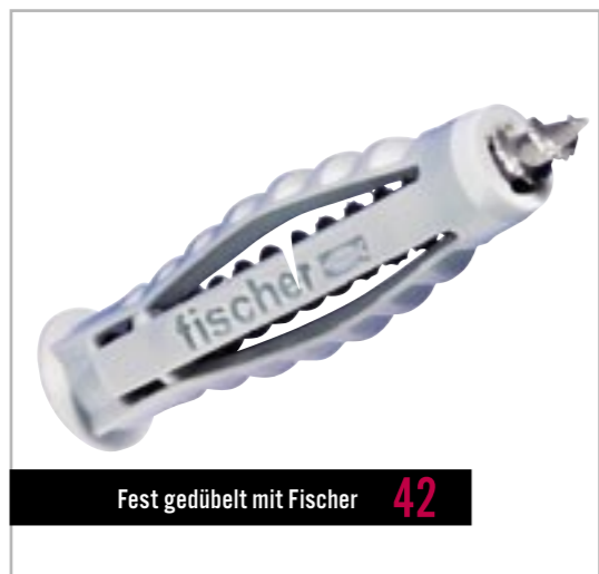
Fest gedübelt mit Fischer 42