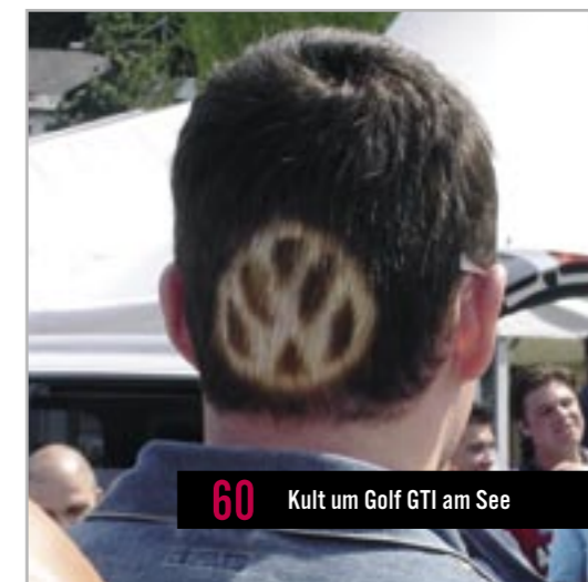
60 Kult um Golf GTI am See