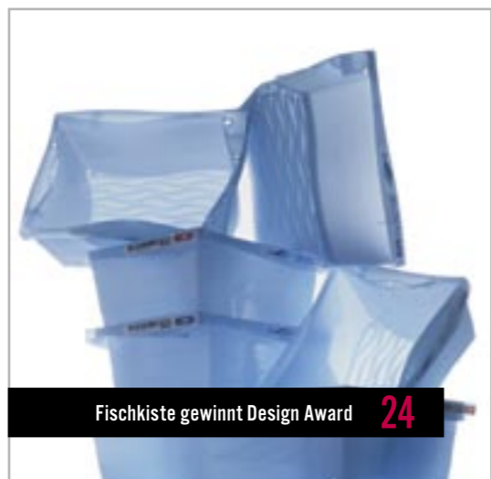
Fischkiste gewinnt Design Award 24