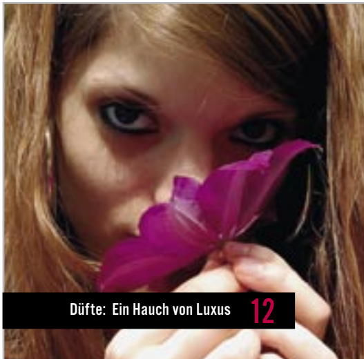
Düfte: Ein Hauch von Luxus 12