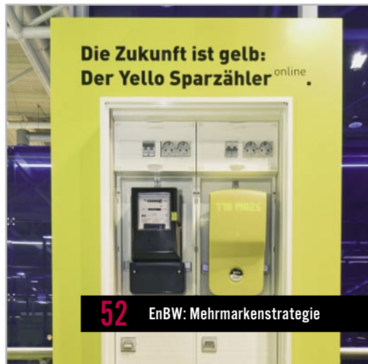
52 EnBW: Mehrmarkenstrategie