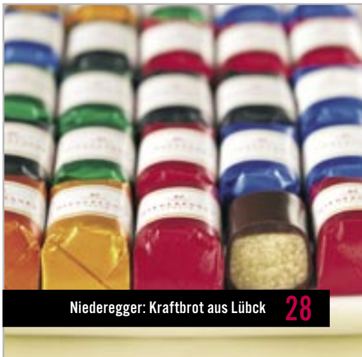
Niederegger: Kraftbrot aus Lübeck 28