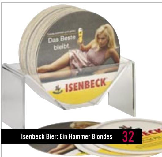
Isenbeck Bier: Ein Hammer Blondes 32