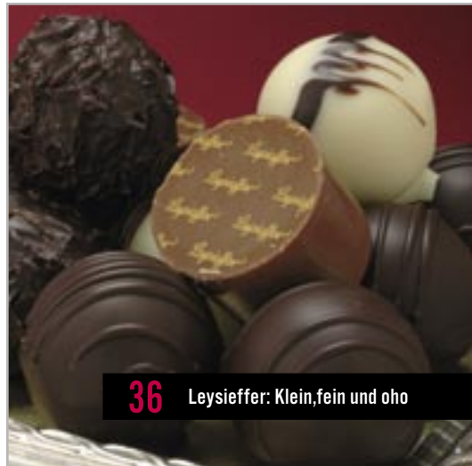
36 Leysieffer: Klein, fein und oho