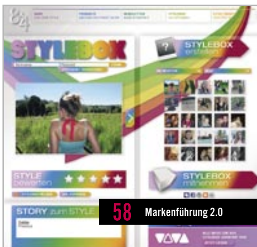
58 Markenführung 2.0