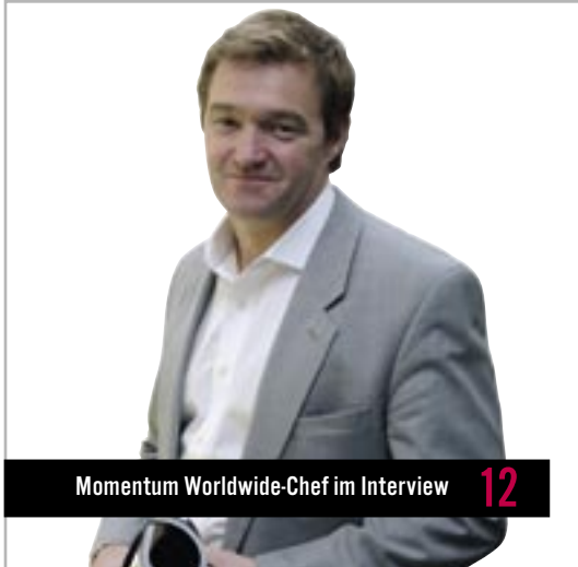
Momentum Worldwide-Chef im Interview 12