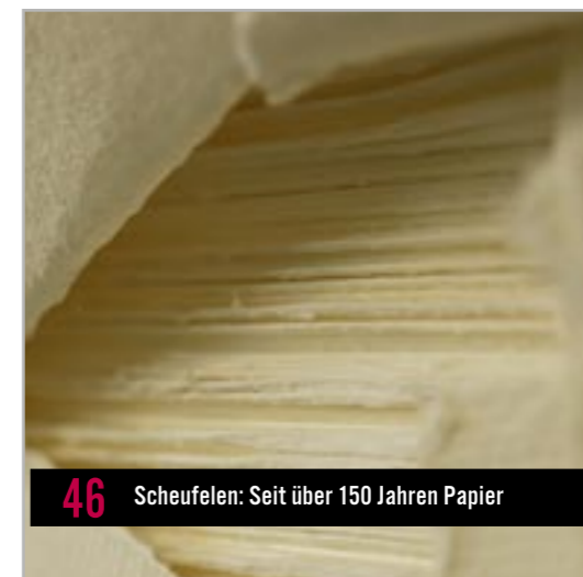
46 Scheufelen: Seit über 150 Jahren Papier