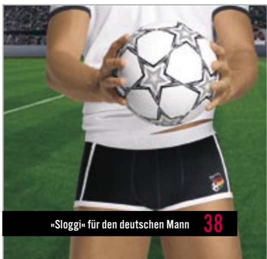
»Sloggi« für den deutschen Mann 38