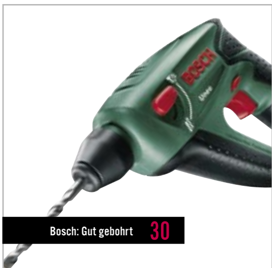
Bosch: Gut gebohrt 30