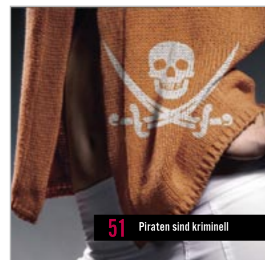
51 Piraten sind kriminell