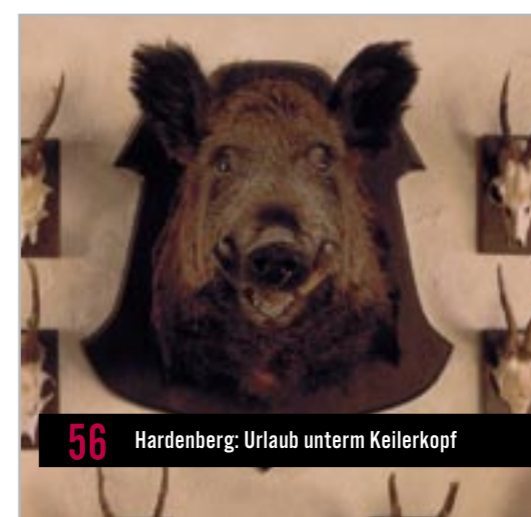
56 Hardenberg: Urlaub unterm Keilerkopf