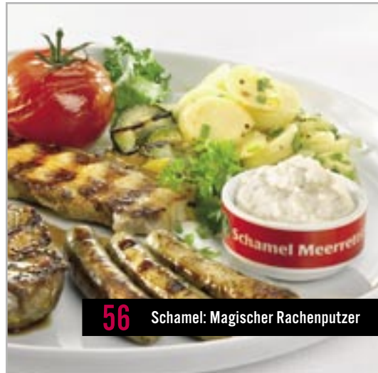
56 Schamel: Magischer Rachenputzer