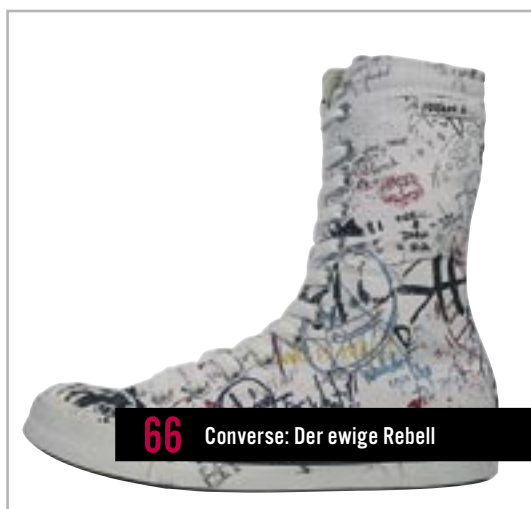
66 Converse: Der ewige Rebell