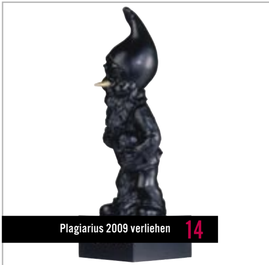
Plagiarius 2009 verliehen 14