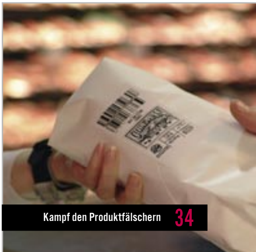
Kampf den Produktfälschern 34