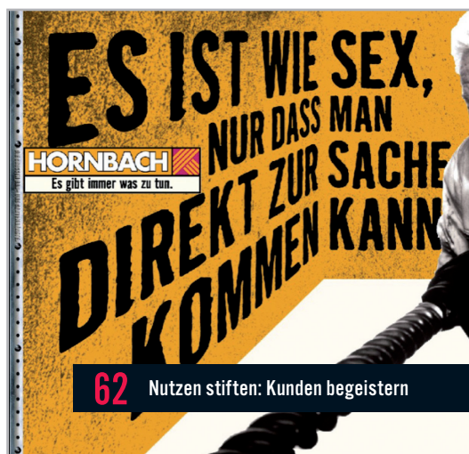
62 Nutzen stiften: Kunden begeistern