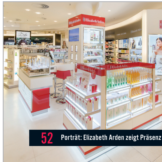
52 Porträt: Elizabeth Arden zeigt Präsenz